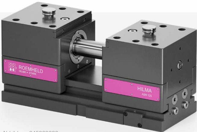
Abbildung 945868036 Lieferumfang HILMA.ASH 125